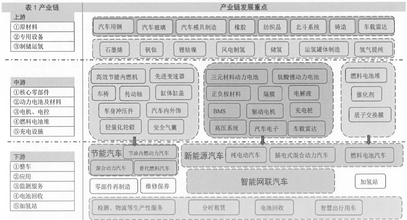
汽车产业链示意图